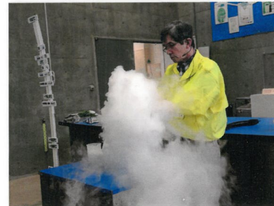
▲ サイエンスワールド 液体窒素の実験ショー

▶ここから見つかる化石は、今から1700万年前(新生代第三紀中新世)の貝・植物などの化石です。きれいなサメの歯や大きなクジラの化石も見つかっています。